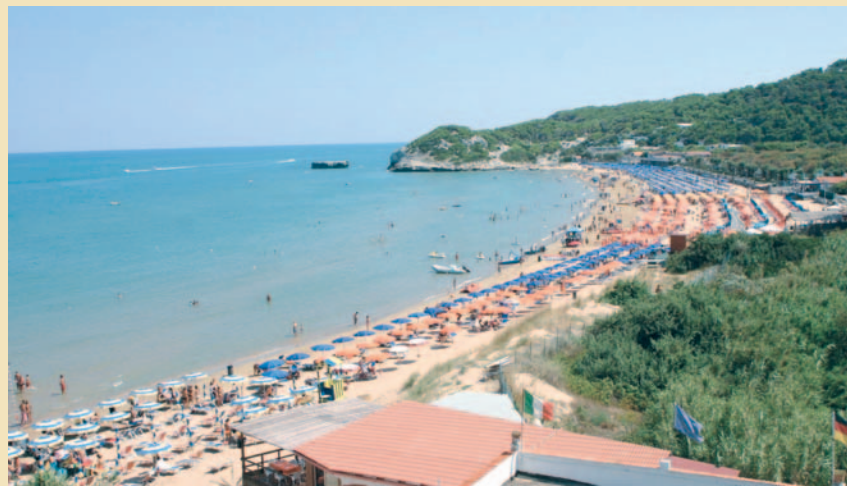
Il litorale di Peschici

Gli albergatori di Peschici lavorano anche di notte per rimettere in sesto le strutture danneggiate dall'incendio del 24 luglio. I turisti sembrano apprezzare, lo sforzo viene sottolineato dalle presenze che sono «nella media del periodo» in tutti gli alberghi e nei camping evacuati durante i giorni post-rogo. Adesso però le apprensioni sono tutte per i nuovi arrivi dei vacanzieri previsti in questa settimana. Disdette poche, tuttavia i turisti prima di partire pretendono al telefono informazioni dettagliate sul villaggio o sull'albergo che dovrà ospitarli. Dalla presenza di estintori e di ambulanze all'interno del centro turistico, all'adozione dei piani antincendio, i turisti adesso fanno domande che fino a una settimana fa nessuno si sognava di porsi.