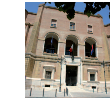
Vigili urbani e lavoratori socialmente utili un piano di assunzione del Comune

La Giunta comunale ha deliberato, questa mattina, la stabilizzazione a tempo indeterminato di 208 dipendenti comunali ed ha approvato la proposta di deliberazione relativa a 4 concorsi pubblici per un totale di 38 posti. Nello specifico sono stati stabilizzati: 95 vigili urbani e 26 ufficiali amministrativi a partire dal 1° ottobre 2007; 31 co.co.co dal 1° agosto 2007 e 56 lavoratori socialmente utili dal 1° gennaio 2008.