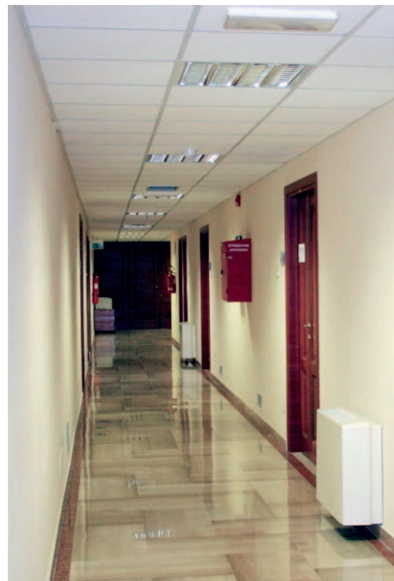
Un interno dei locali che ospiteranno la sede dell'Authority